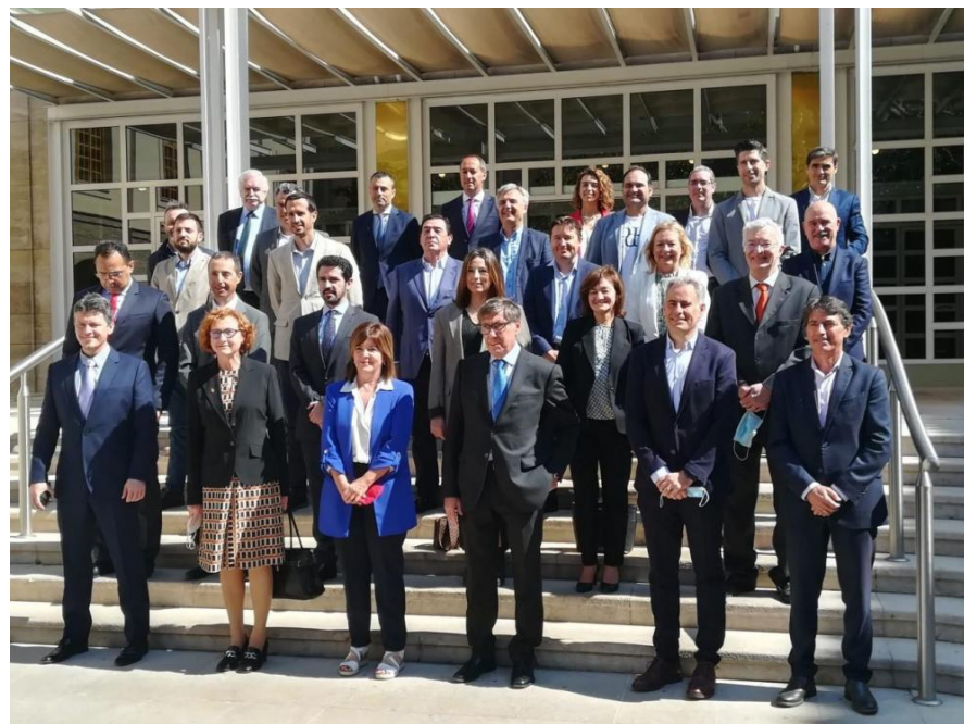
Constitución de la Red 18/04/22

Colaboración con empresarios reconocidos, que, ejerciendo como mentores de los proyectos nacientes, aportan su experiencia y orientación favoreciendo así el enfoque estratégico y la viabilidad de los mismos.